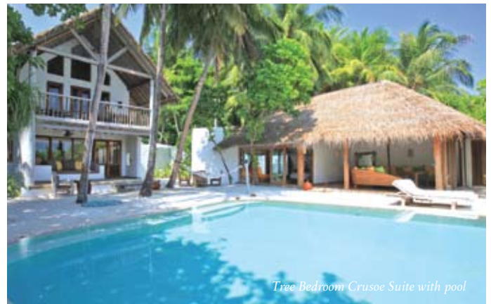
Tree Bedroom Crusoe Suite with pool