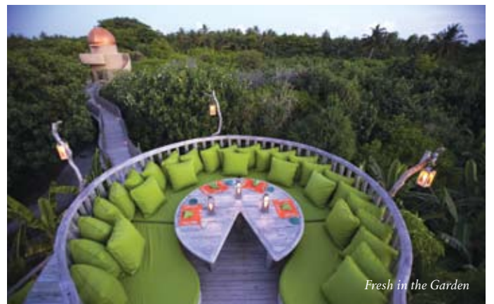
Fresh in the Garden

距离索尼娃芙西15分钟的快艇, 有一个属于渡假村的沙滩孤岛。传统的马尔代夫佳肴, 采用的是真正的慢食方式, 每晚只为18人准备的独特用餐经历。